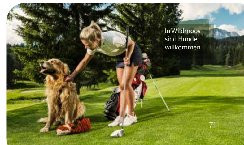
In Wildmoos sind Hunde willkommen.

GOLFCLUB SEEFELD-WILDMOOS , Wildmoos 11, A-6100 Seefeld, Tel: +43 (0)5212 52402, www.seefeldgolf.com