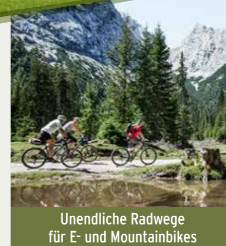
Unendliche Radwege für E- und Mountainbikes

Golfen in der Olympiaregion Seefeld ist ein echtes Naturerlebnis in malerischer Landschaft. Vor über 50 Jahren wurde der 18-Loch-Platz mit perfekten Fairways und Greens harmonisch in die Almregion eingefügt. Er gehört heute zu den Leading Golfcourses Austria. In einem einzigartigen Projekt zur Erhaltung der Biodiversität, Erlebbarkeit und Artenvielfalt werden hier gezielt optimale Lebensbedingungen für gefährdete Tierarten geschaffen und es wird auf mechanisch-biologisches Greenkeeping umgestellt. Der 1.300 Meter hoch gelegene Golfplatz bietet für jedes Handicap eine entsprechende Herausforderung und garantiert unvergessliche Golfmomente. Charakteristisch sind wenige Bunker auf