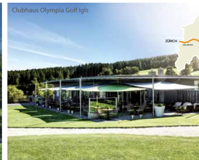
Clubhaus Olympia Golf Igls