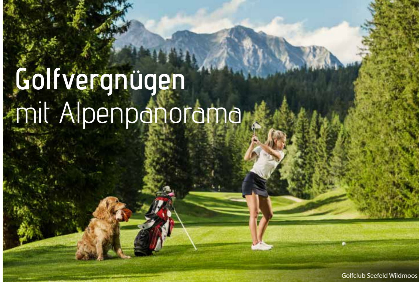
Golfclub Seefeld Wildmoos

Die Tiroler Golfregion Innsbruck – Seefeld – Mieming, im wahrsten Sinne im „Herzen Tirols“, ist ein Traum für Golfer. Sieben Golfanlagen, vom sportlich ambitionierten Meisterschaftsplatz bis hin zur 9-Loch „Pay and Play“-Anlage, bieten nicht nur Golf vom Feinsten, sondern auch Naturnähe und atemberaubenden Ausblicke in die Tiroler Bergwelt. Das Freizeitprogramm, abseits vom Golf, ist vielseitig.