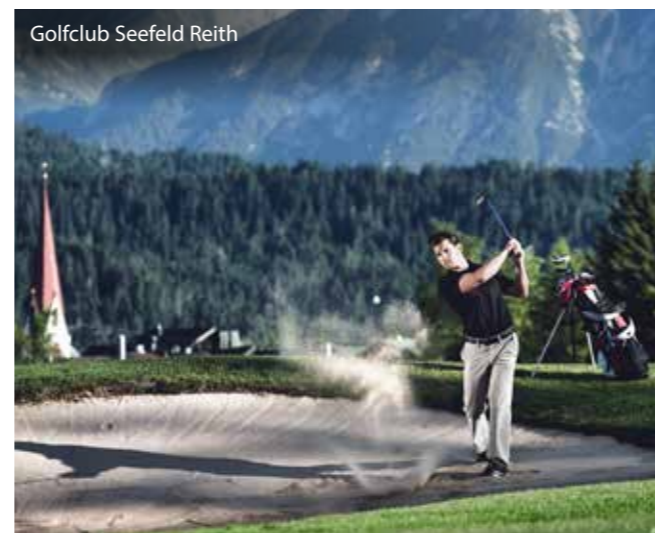
Golfclub Seefeld Reith